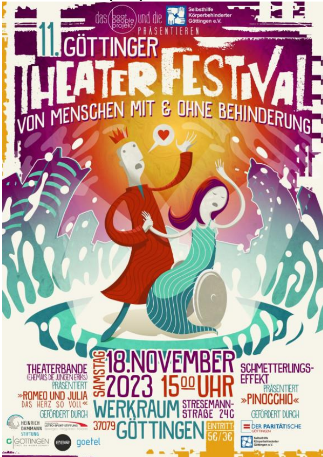
Plakat vom Theaterfestival 2023

Seit mehreren Jahren kooperiert unsere Theatergruppe „Schmetterlingseffekt“ mit dem boat people projekt und ihrer Gruppe „Theaterbande“ (ehemals „die jungen ERIKS“). Seit ein paar Jahren organisieren sie gemeinsam das „Göttinger Theaterfestival von Menschen mit und ohne Behinderungen“ in den Räumen der boat people.